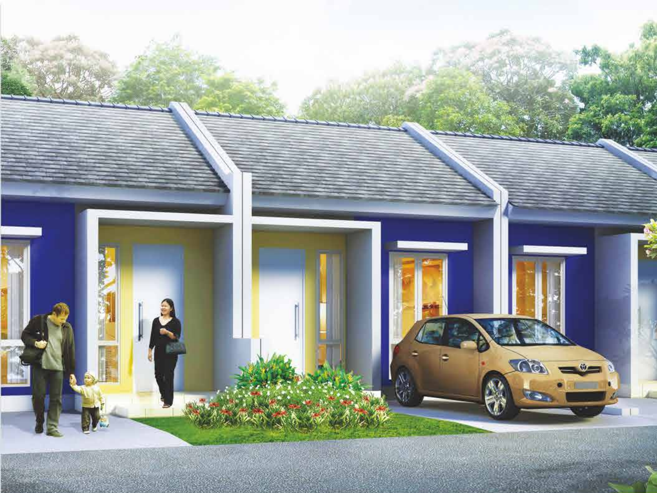
TIPE TULIP 27 / 60