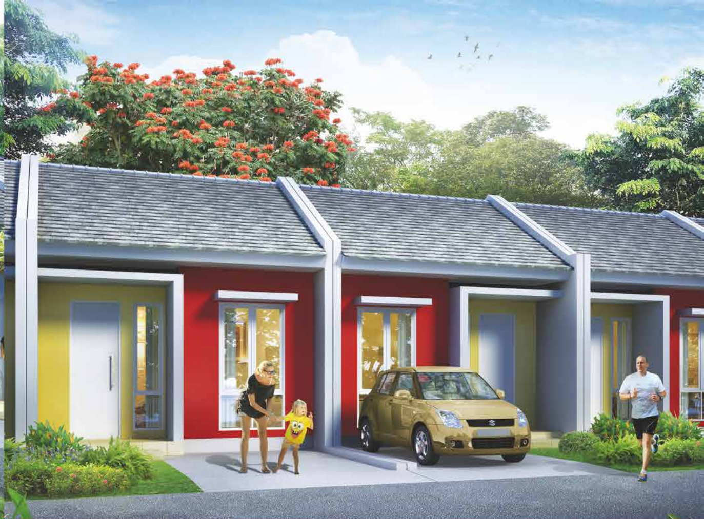
TIPE THALIA 36 / 60